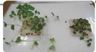
成長の違いがはっきり！

人工汚染布を使い洗浄効果をみる実験と、そこで使った洗浄液で環境負荷を考えるため発芽実験を行ないました。