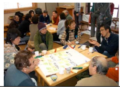
午後は4つのグループで新たな事業を模索中