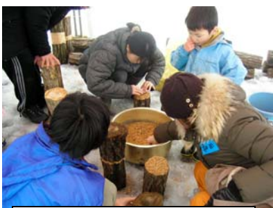
ひらたけの原木栽培講習会