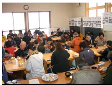
昼食は大賑わいです！