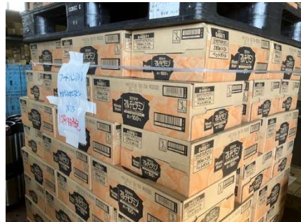
北陸コカ・コーラ様より飲料