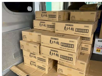
JA福井県経済連様よりむぎとろ麺