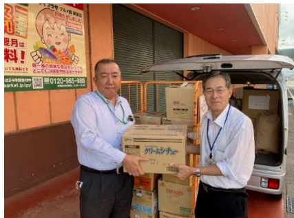
ヤスサキ様より本社にてグルメ館5店舗より