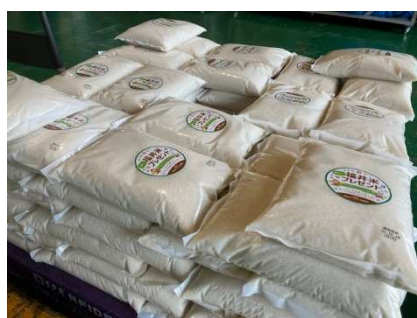
福井パールライス様よりお米