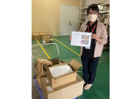
リコージャパン福井支社様より