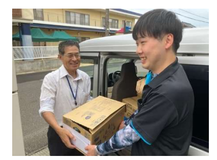
福井森林組合連合会様より