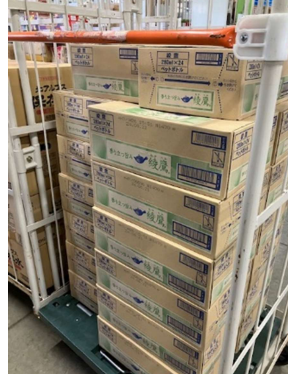
ベネフレックス様より お茶20ケース