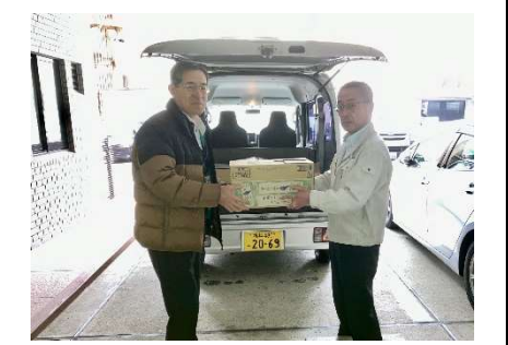
福井県漁業協同組合様より 職員の皆さんのフードドライブ食品