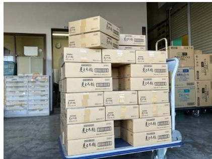
JA福井県経済連様よりむぎとろ麺