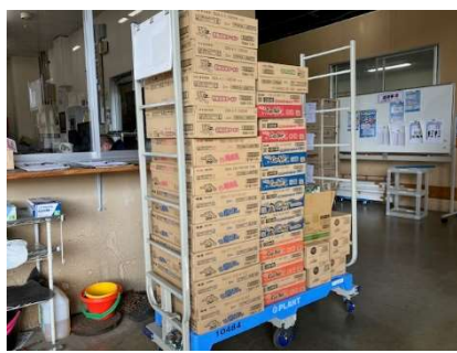
PLANT 清水店・坂井店様より