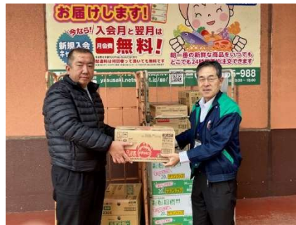
ヤスサキ様グルメ館6店舗より (ラップなど日用品もいただきました)