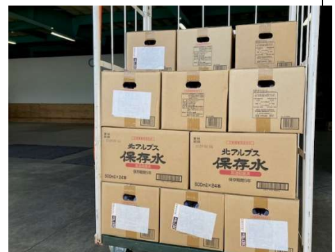
大和ハウス工業福井支社様より 災害用備蓄品の水400本