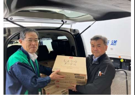
バローホールディングス様より