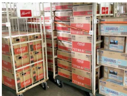
北陸コカ・コーラ様より 飲料100ケース