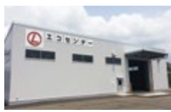
エコセンター外観

組合員や事業所から出る紙やプラ類を集約し、品質の高いリサイクルの一次加工を行う施設を2015年6月に設立しました。県民せいきょうグループ「一般社団法人ほのほのハーツ」で障がい者雇用を行い、就労支援の場づくりとしても位置づけています。