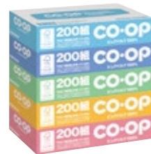
コープティッシュ▶