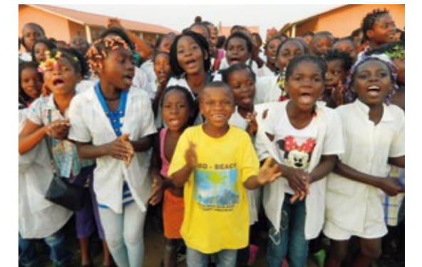
■エシカル消費月間(環境月間)実績

CO・OPコアノンロールシリーズ1パックの利用につき1円を、ユニセフを通じてアンゴラ共和国の「子どもにやさしい学校づくり」に寄付をしています。「人を育てる」「知識を伝える」ことを目的に教師を育成したり、「設備を整える」ことを目的に安全な水の整備やトイレの設置を行っています。