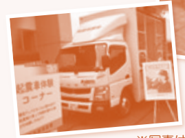
※写真は昨年の会場の様子です

※イベントチラシに掲載しています企画は、チラシの配布以前より募集を開始している企画もあります。ご応募いただいた時点で定員に達していた場合はご容赦願います。※イベント開催当日の写真を、県民せいきょうのホームページ掲載や、広報紙(組合員への配布や店内配布など)に掲載する場合がございますのでご了承願います。