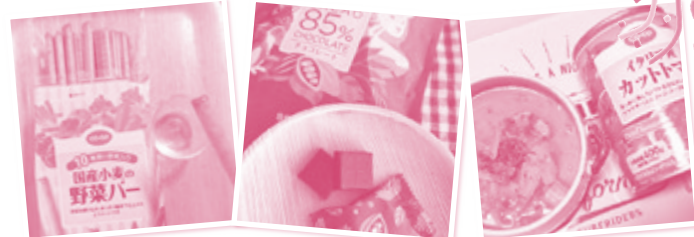
さんかくおにぎりさん