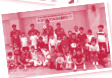
▲昨年、奥越・福井会場で開催されたサウルコスと遊ぼう!!の様子