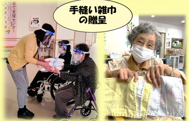
手縫い雑巾の贈呈