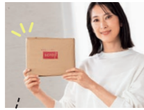
お届け時はA4サイズ