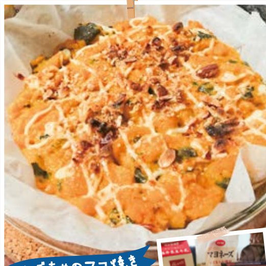
かぼちゃのマヨ焼き