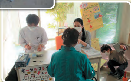
歯科で行われたオーラルフレイル予防チェック