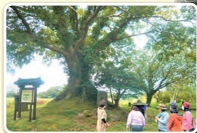
▲あわら千束一里塚 県内で江戸時代から残っている一里塚は二か所 千束は、そのひとつ

11月3日には恒例「秋の文化祭&青空市」を開催しました。バザー&ハンドメイドの店で大賑わい、ハッピー農法班の先生が、自宅で育てる「かいわれ大根の水耕栽培」コーナーでのお話には、たくさん質問がありました！キッズのコーナーではXmasカードづくり、さかい生協歯科所長からのオーラルフレイル予防チェックや骨密度測定など盛りだくさんの企画にたくさんの家族連れが訪れて貴重な秋の青空の下で時間が過ぎ、とても楽しく過ごしました。