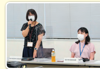
▲来賓 福井県循環社会推進課・児童家庭課ご挨拶