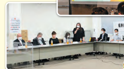
▲子ども食堂ネットワークふくいから共同代表・運営委員4人が出席され報告いただきました