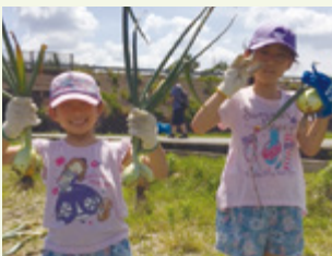
▲永平寺やさい村で新玉ねぎ収穫体験(第1地区)

産直協議会では、産地見学や出前講座などを通して、生産者と組合員の交流を積極的に行っています。2020年度は、コロナの影響で各地区の交流活動が十分にできなかったため動画を作成し店内で流すことで産地の状況や生産者の想いをお伝えしました。各地域の生産者の声やこだわり、苦労など、生の声を聞くことで商品のファンになり、生産者の顔が見える関係づくりにつながっています。