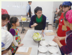
▲丹生寺坂農園の麴のお話(第2地区)