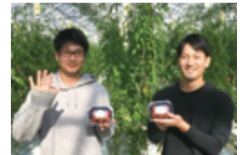
▲福井和郷のトマト