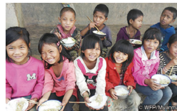
2020年度(2020年10月1日~11月10日) 全国の生協の募金総額 5,047,714円

対象の商品1品につき1円が、国連WFPを通じて飢餓に苦しむ子どもたちに学校給食を届けるために使われます。2017年度からカンボジア王国、2020年度からはミャンマーに支援を行っています。児童の栄養改善、就学率、出席率の向上及びミャンマー連邦共和国による自立した学校給食運営のための人材育成を目標とします。