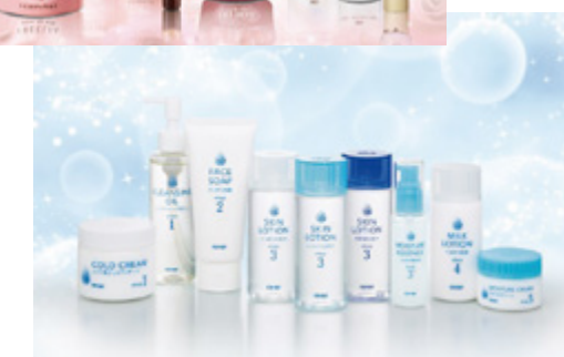
全体の募金実績 1,572,804円