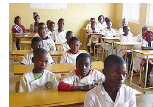
2019年11月1日~2020年10月31日 全国キャンペーンで集まった募金総額 11,181,240円

CO-OPコアノンロールシリーズ1パックの利用につき1円を、ユニセフを通じてアンゴラ共和国の「子どもにやさしい学校づくり」に寄付をしています。「人を育てる」「知識を伝える」ことを目的に教師を育成したり、「設備を整える」ことを目的に安全な水の整備やトイレの設置を行っています。