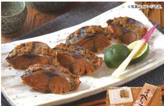
※写真はイメージです。

ハーツが一番人気の高い、越前 田村屋さんのへしこの詰合せです。特に米ぬか、塩、米こうじにこだわり、仕上げています。