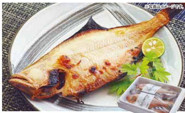
※写真はイメージです。

4053 早割 本体 3,380円(税3,650円) 9053 本体 3,680円(税3,974円)