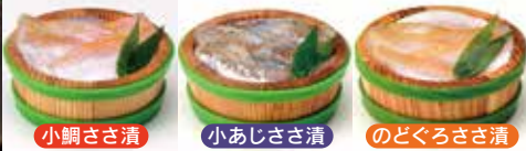
小鯛ささ漬 小あじささ漬 のどぐろささ漬