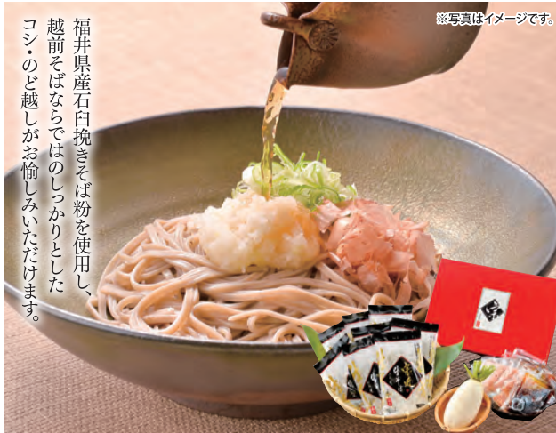
宗近 越前おろしそばセット

4064 早割 本体 3,150円 (税3,402円) 9064 本体 3,350円 (税3,618円)