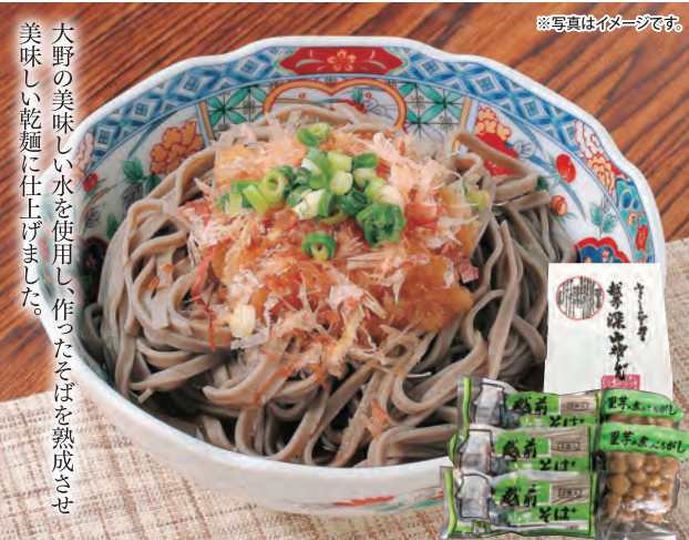
越前そばと里芋のセット

乾麺(麺90g×2、つゆ40g×2)×3、里芋(約350g)×2 [賞]そば180日、里芋60日 石塚七左工門商店