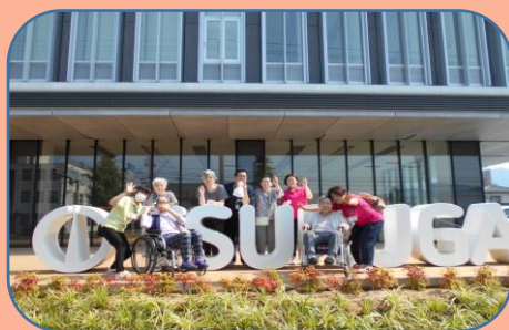
2022年6月 敦賀市役所新庁舎を見学