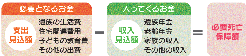
(図2) 3段階の保障のイメージ